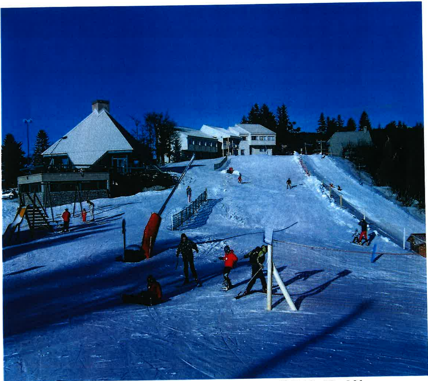
STATION DE SKI DE LA CROIX DE BAUZON